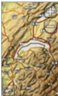
Základní mapa se stínováním terénu