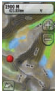
Topografická mapa Evropy 1:100 000