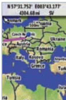
Ukázka displejů GPSMAP 62s